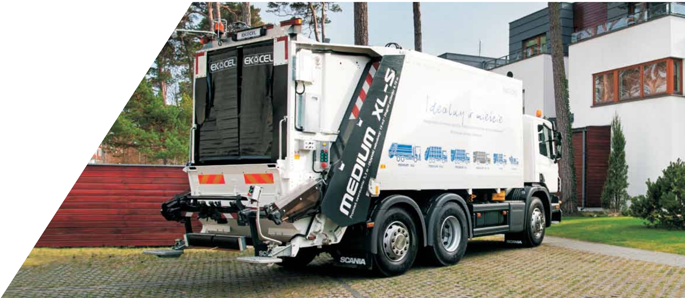
System urządzeń załadowniczych SK 350